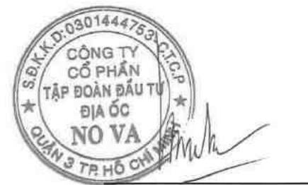
Bùi Thành Nhơn Chủ tịch Hội đồng Quản trị Ngày 30 tháng 04 năm 2018

Các thuyết minh từ trang 10 đến trang 58 là một phần cấu thành báo cáo tài chính riêng này.